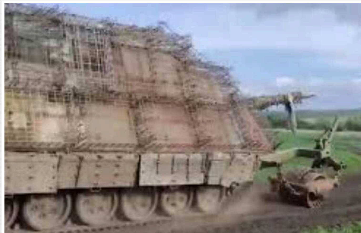
ЗСУ на півдні подвійним ударом знищили російський «танк-черепаха»

Українські військові знищили російський танк Т-62 на півдні. "Танк-черепаха" згорів після подвійного удару.