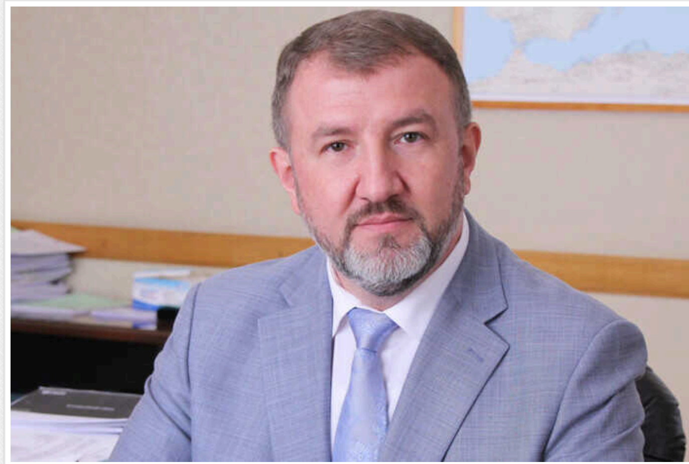
В Україні через прості у роботі ТЕС виник надлишок вугілля

Цього року через постійні обстріли росіянами теплоелектростанцій України, майже всі ТЕС знаходяться в простій та не можуть повноцінно працювати, через що держава наразі має надлишок вугілля.