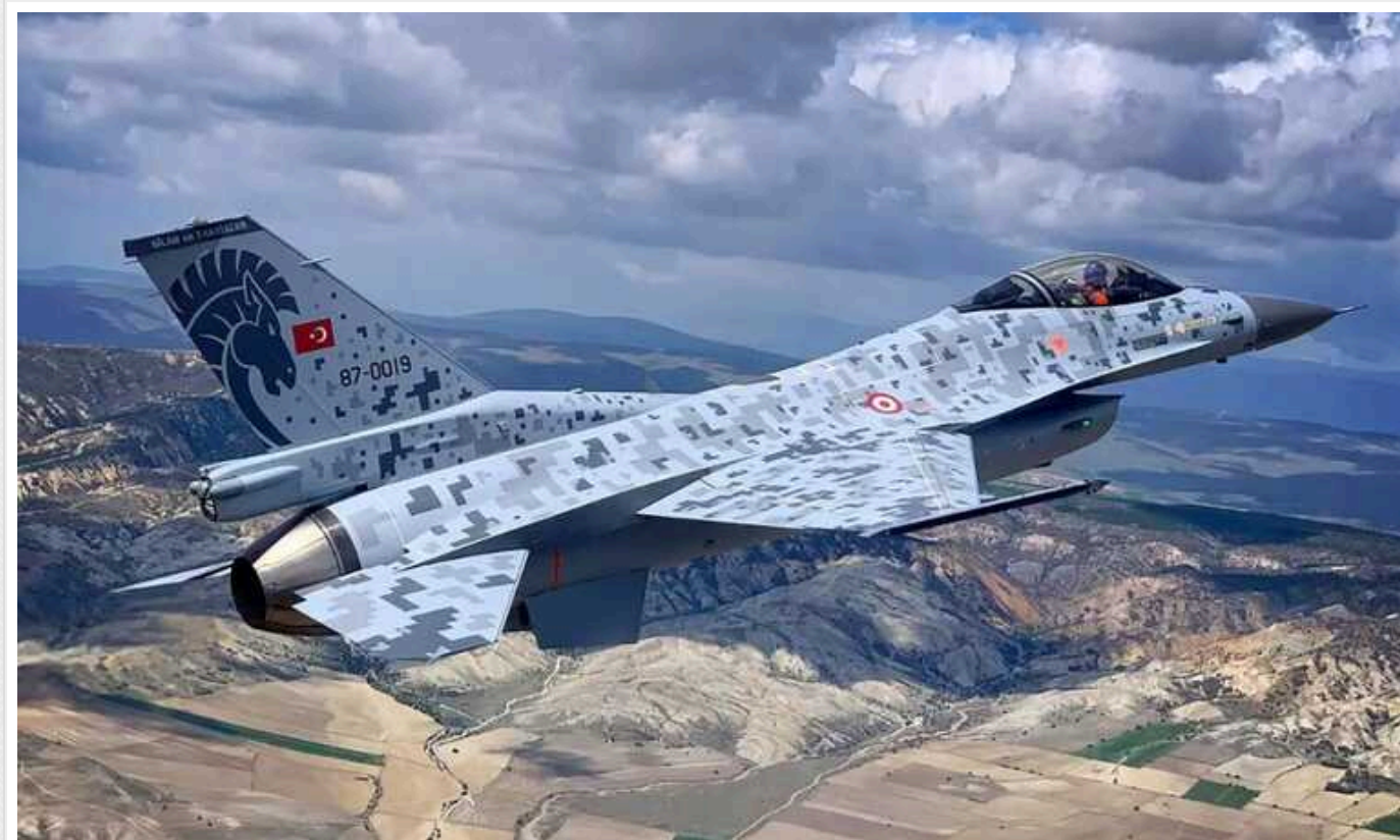
Туреччина скасує угоду з США на 23 мільярди доларів на постачання F-16, – ЗМІ

Туреччина збирається скасувати запланований контракт зі США на суму 23 мільярди доларів на придбання винищувачів F-16 та прагне отримати угоду, що передбачає виробництво деяких компонентів літаків у себе в країні.