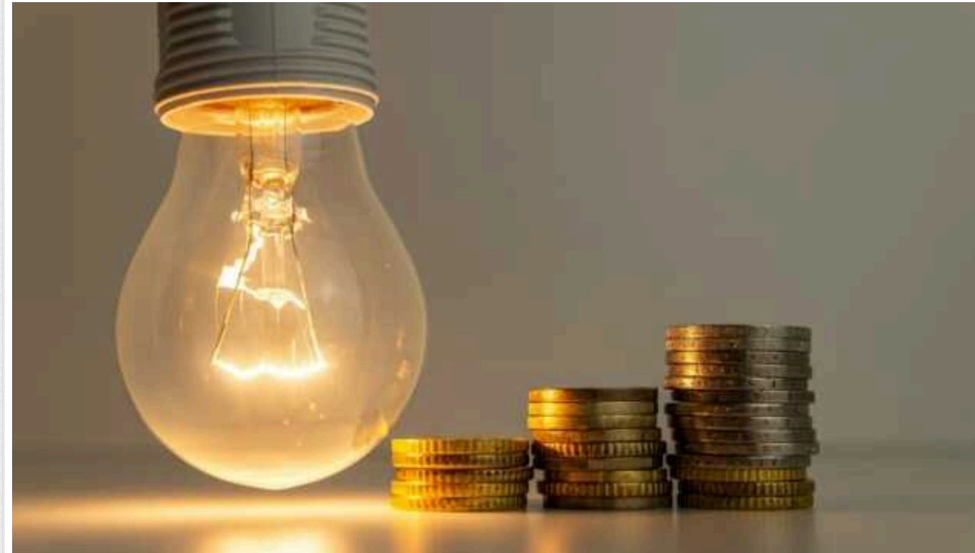
Міненерго обіцяє не підвищувати тариф на світло до 1 травня 2025 року

Про це йдеться у відповіді міністра Германа Галуценка на запит нардепа Олексія Кучеренка.