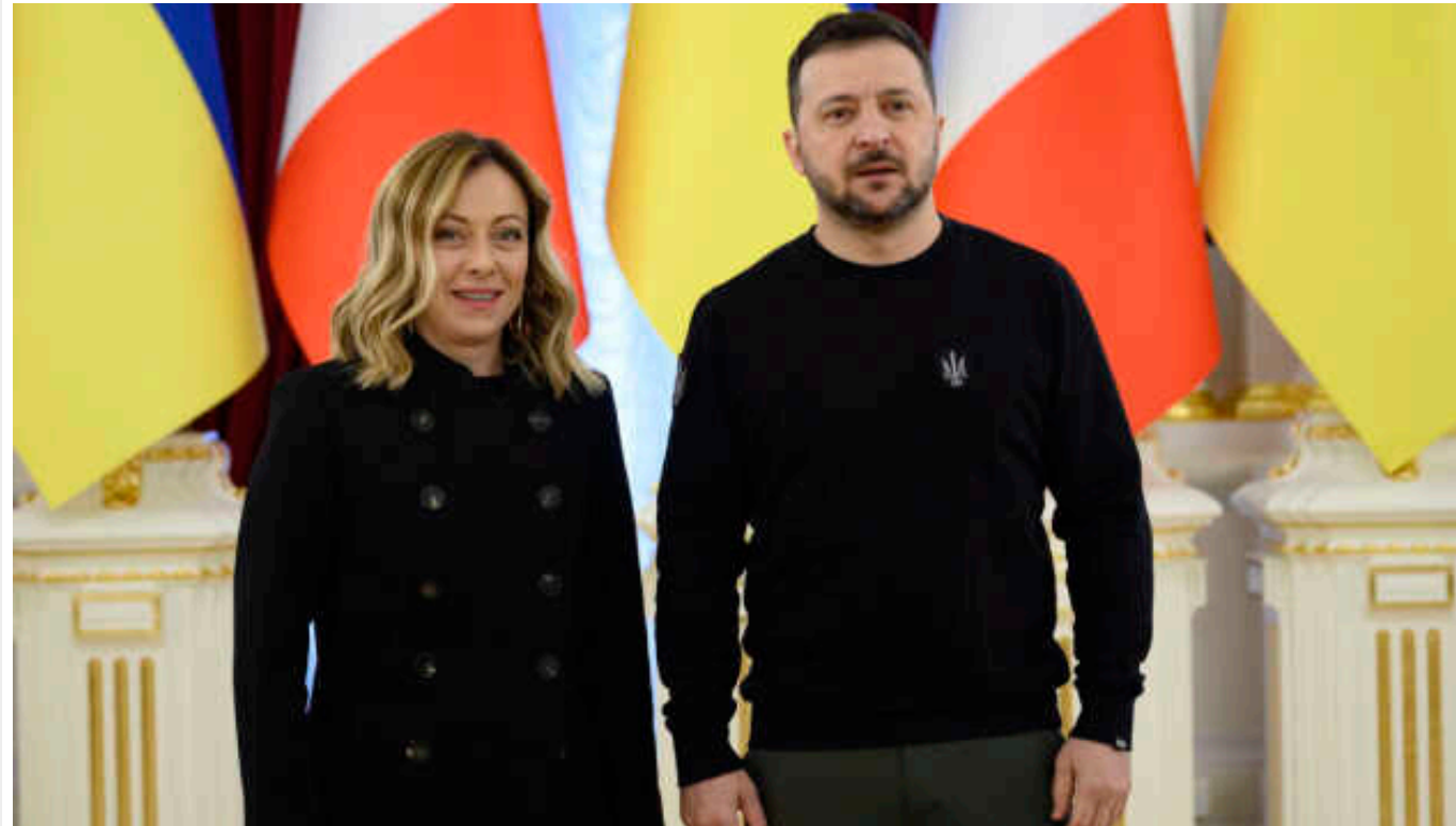
Зеленський та прем'єрка Італії Мелоні обговорили ППО для України

Президент України Володимир Зеленський зустрівся у Вашингтоні з головою Ради міністрів Італії Джорджею Мелоні. Сторони обговорили потреби України у протиповітряній обороні.