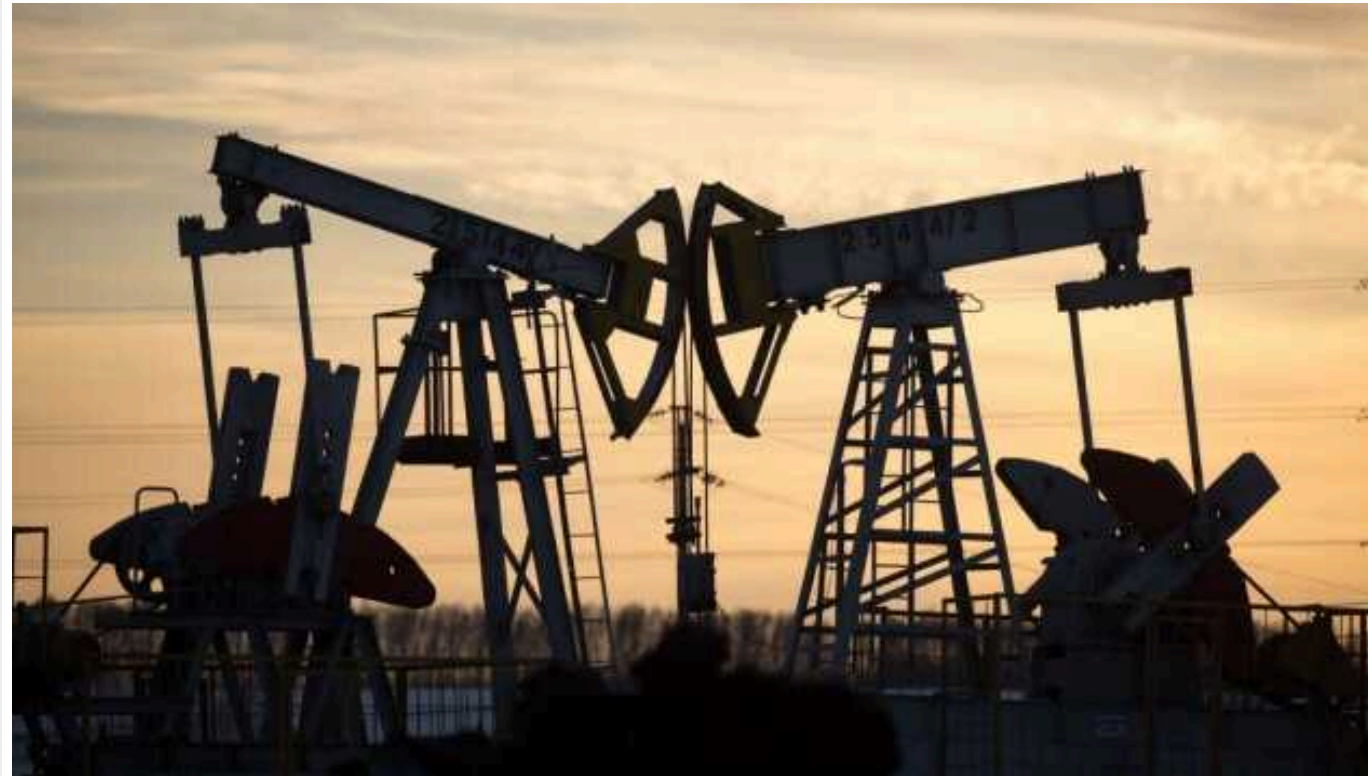
На фоні ознак послаблення інфляції в США зросли ціни на нафту

Ціни на нафту зросли в п'ятницю на фоні ознак послаблення інфляційного тиску в США, найбільшому споживачі нафти в світі, хоча контракти готувалися до тижневого падіння.