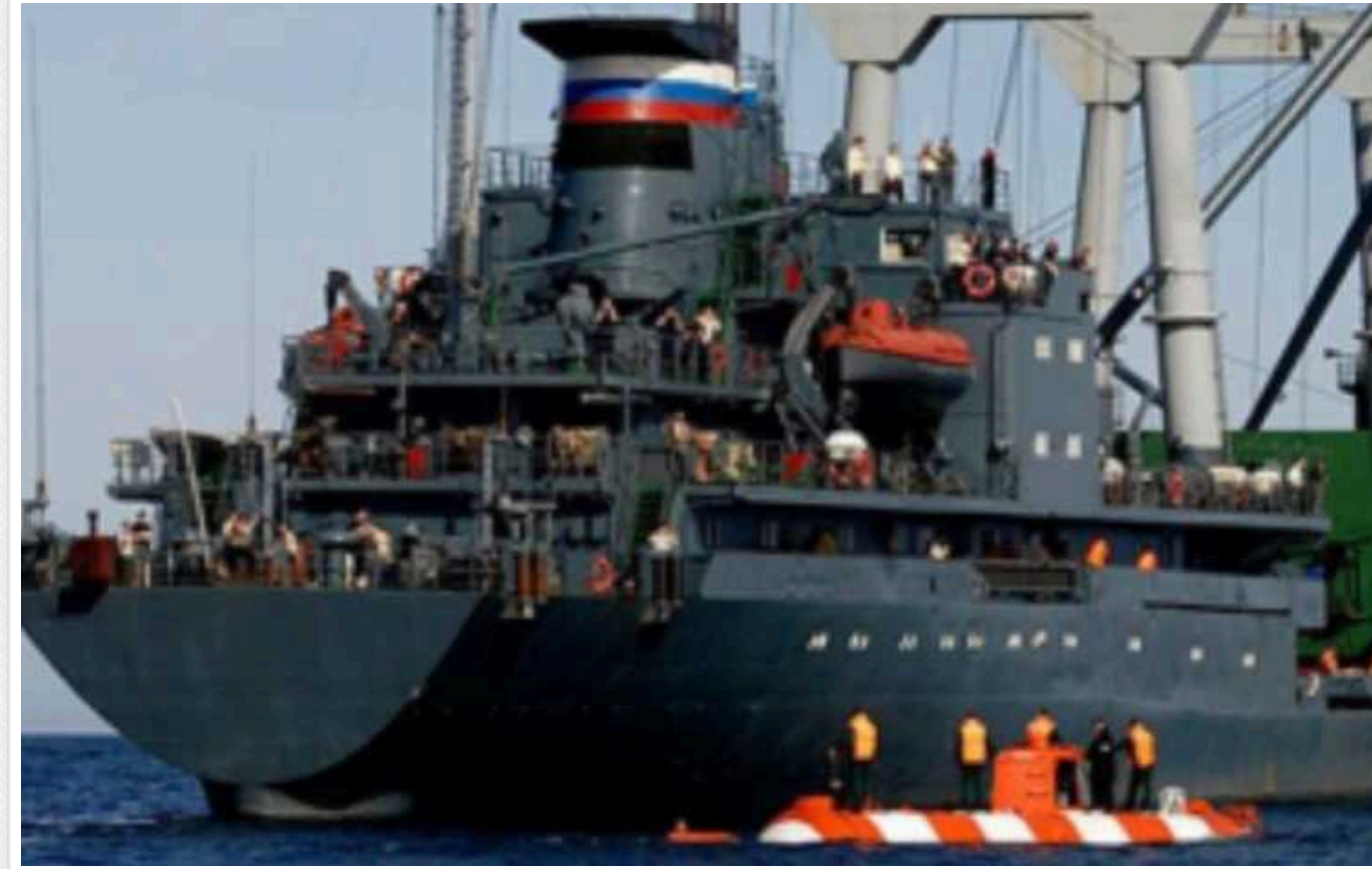
У Норвезькому морі зіткнулися корабель та глибоководний апарат

У Норвезькому морі зіткнулись російський корабель "Михайло Рудницький" та глибоководний апарат "АС-36". Це відбулось під час випробувань.