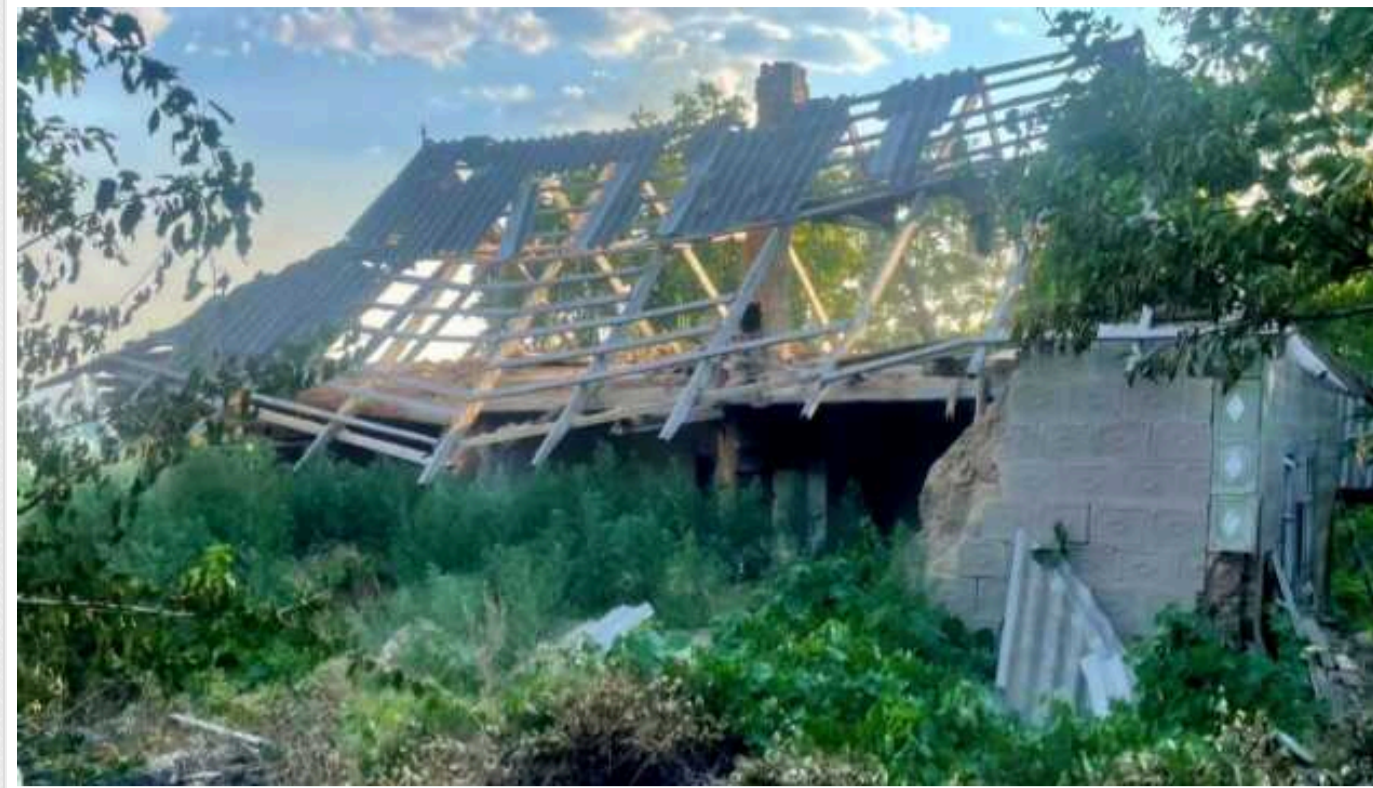
Окупанти вранці атакували дроном-камікадзе Нікополь