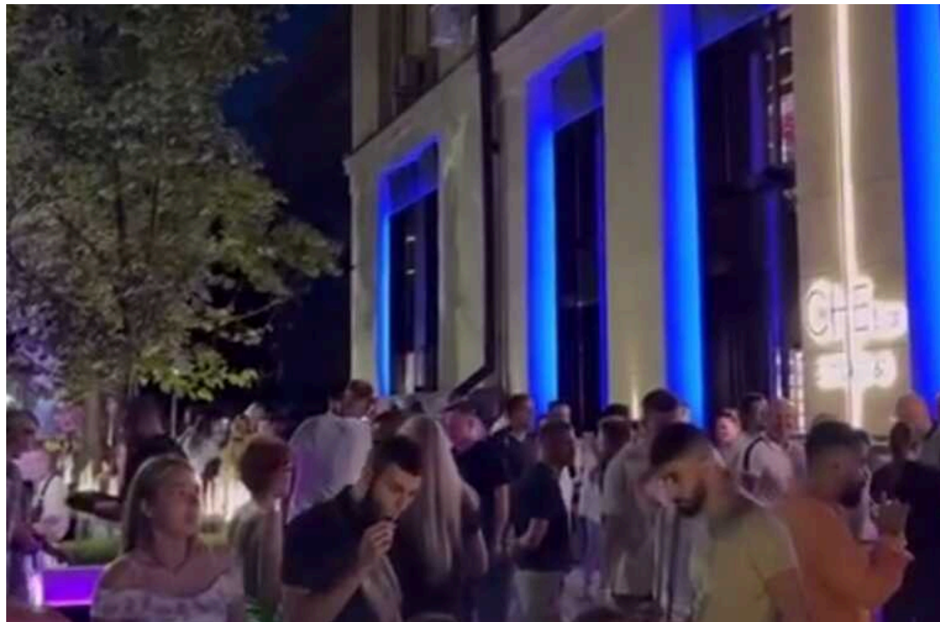
Нечего немає війни: кадри галасливого "двіжу" у центрі Харкова

Місцевий бар учора опублікував нарізку відео галасливих вечірок із танцями на центральній вулиці Сумській.