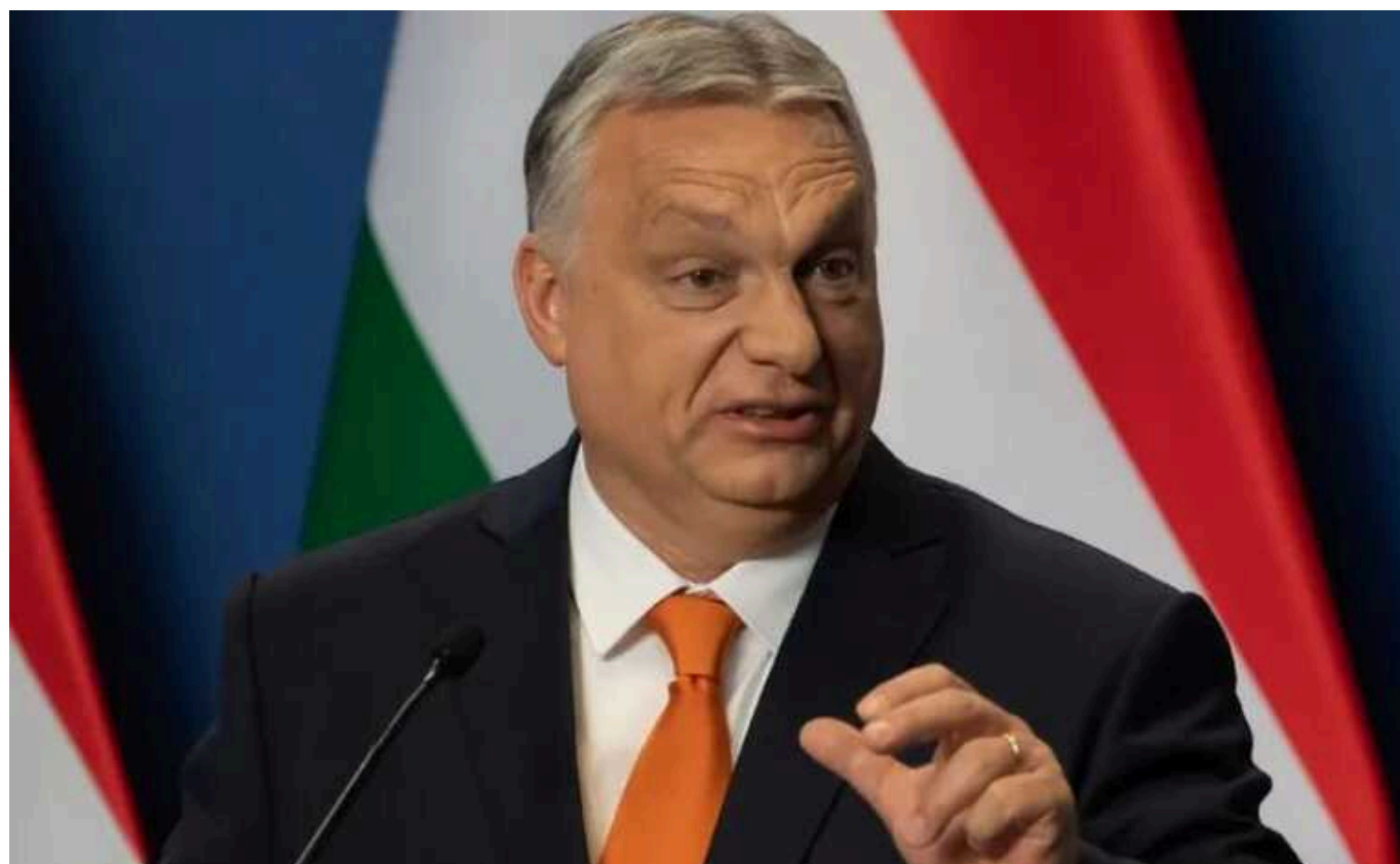
FT: У ЄС заявили, що поїздка Орбана до Путіна порушила договори, тепер йому готують покарання

Юридична служба Європейського Союзу заявила, що дипломатичні контакти прем'єр-міністра Угорщини – країни, яка наразі головує у ЄС, – суперечать внутрішнім договорам Євросоюзу. Зокрема, юристи служби повідомили країнам ЄС, що дії Віктора Орбана порушують договори, які забороняють будь-які "заходи, що можуть поставити під загрозу досягнення цілей Союзу".