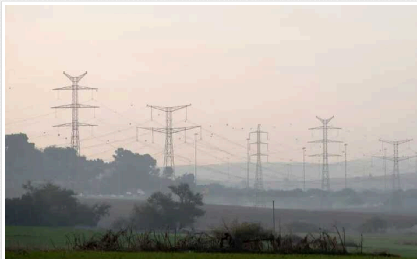
Імпорт з ЄС уперся в стелю: Україні більше ніде взяти світла

Україна зіткнулася з новим викликом – неможливістю імпортувати більше електроенергії, щоб подолати кризу і зменшити тривалість відключень світла. Енергетична система дійшла до максимально дозволеного показника постачання струму з Європи та вперлась у стелю.