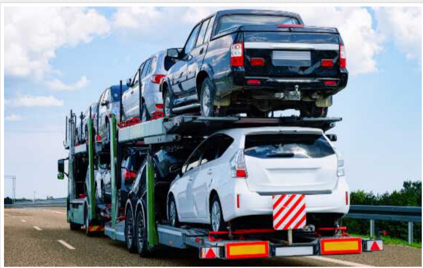
У Росії стало складніше купувати автомобілі, - росЗМІ

Росіяни все менше можуть дозволити собі покупку автомобіля, доступність автомобілів у країні впала до історичного мінімуму.