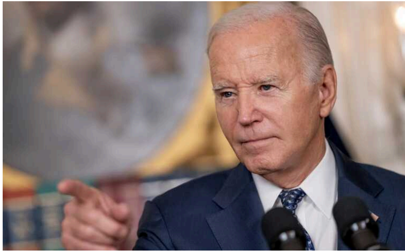
Байден на саміті НАТО оголосив про новий пакет військової допомоги Україні

Президент США Джо Байден у четвер, 11 липня, оголосив про виділення Україні чергового пакета американської військової допомоги.