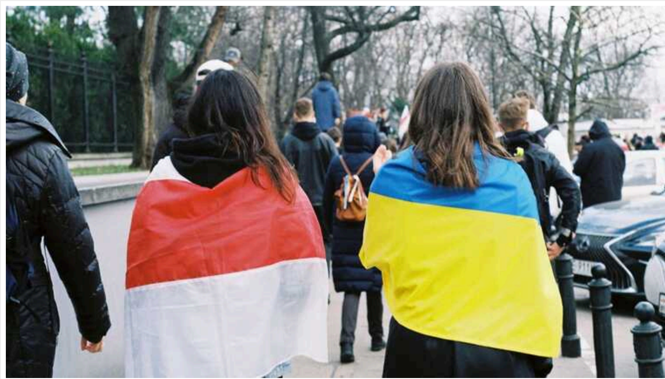
Більше половини поляків підтримують збиття російських ракет над Україною, – опитування