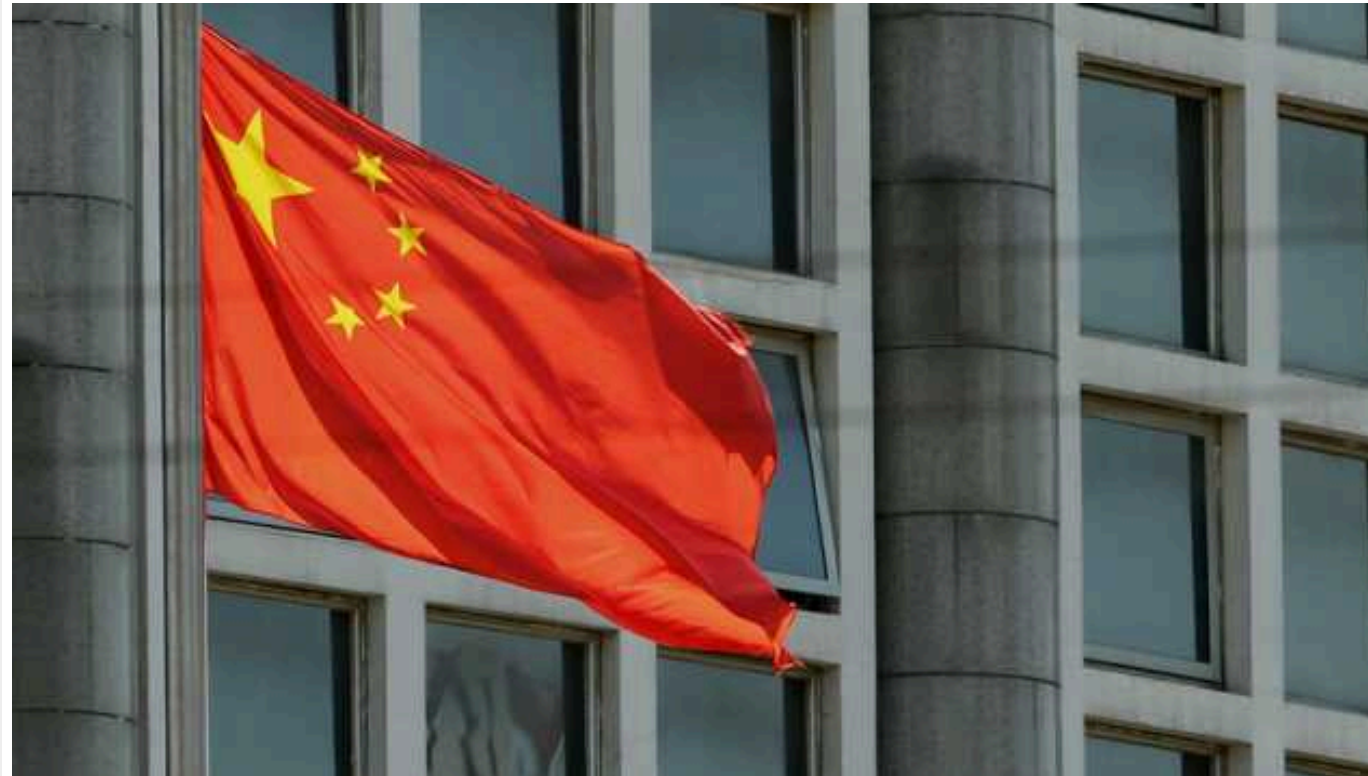
КНР обурило рішення саміту НАТО через згадку про співпрацю з РФ

Офіційний Пекін обурився через рішення саміту НАТО у Вашингтоні, в якому було названо Китай вирішальною силою, що сприяє війні РФ проти України.