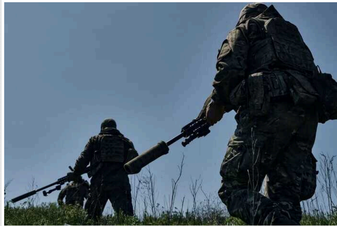
ISW: Росія стала відчувати тиск контрактак ЗСУ

Російські війська починають відчувати тиск українських контрактак. У той же час, здатність ЗСУ проводити потужні контратаки, як і раніше, залежить від допомоги Заходу.