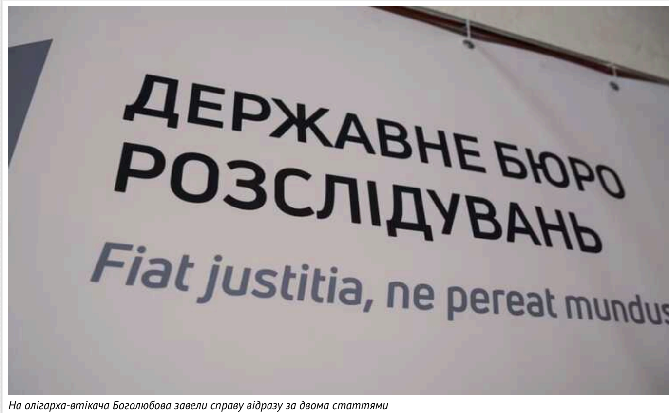
На олігарха-втікача Боголюбова завели справу відразу за двома статтями

Партнер Коломойського втік із країни за чужим паспортом і збирається просити притулок у Великій Британії.