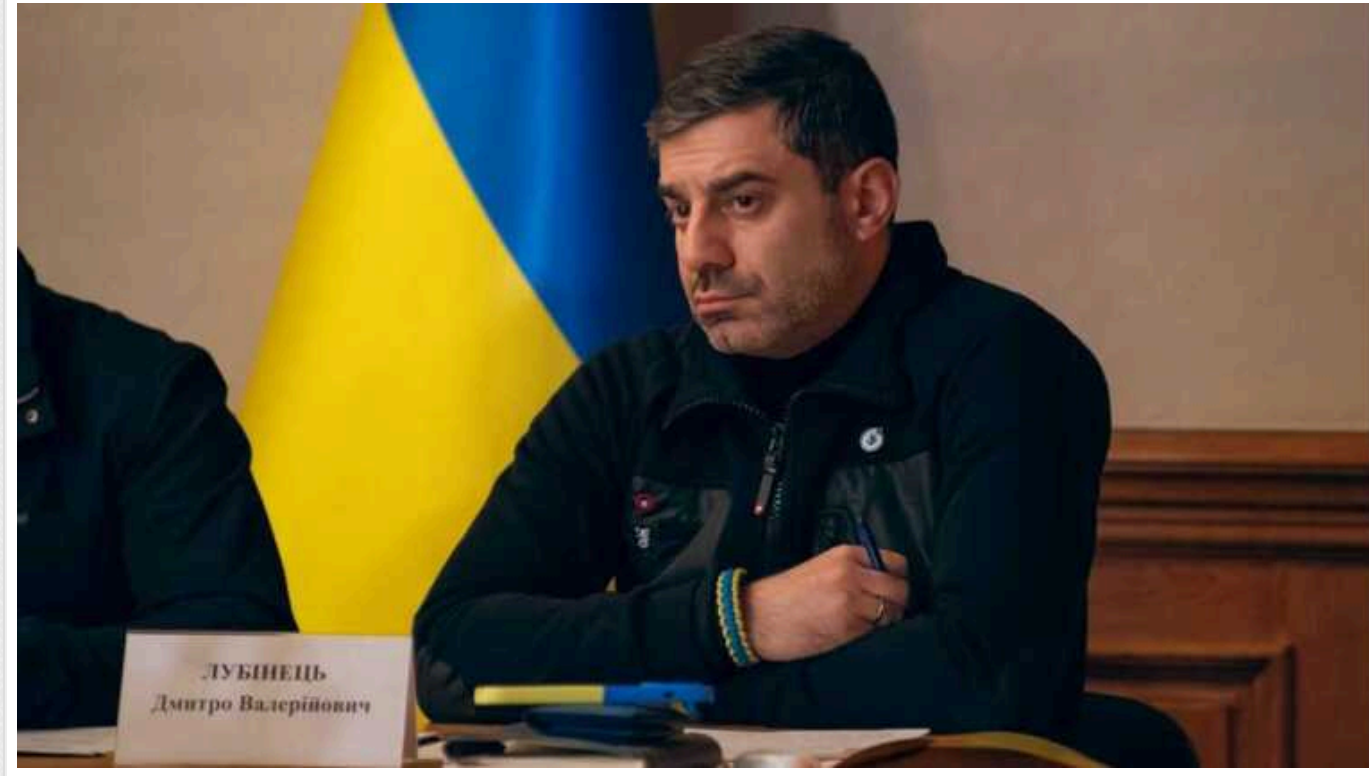
Омбудсмен Лубінець анонсував великий обмін жінок-військовополонених

Україна планує великий обмін з Росією, у ході якого повернуть жінок-військовополонених.