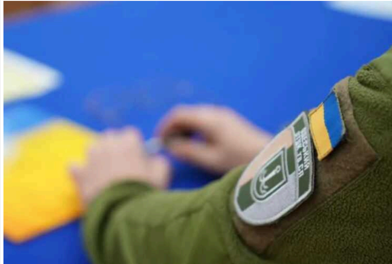
Напади на працівників ТЦК: в Офісі генпрокурора розповіли, скільки справ дійшли до суду

За даними правоохоронців, за перше півріччя 2024 року вдалося зареєструвати 116 кримінальних проваджень за статтею 342 Кримінального кодексу України. У них ідеться про опір працівникам поліції та військовим, однак до суду дійшли не всі випадки.