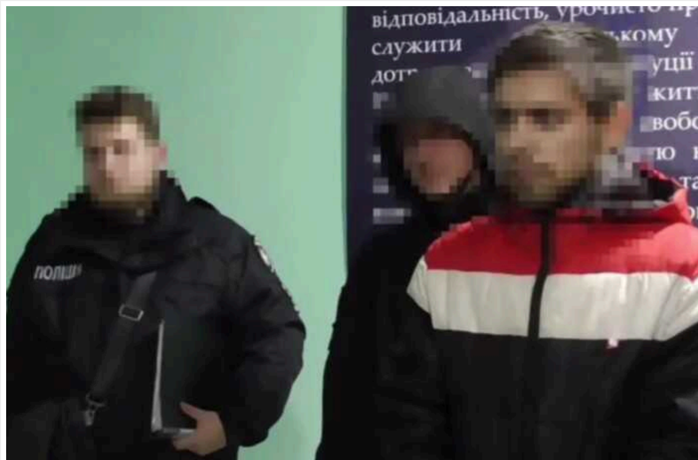
Мешканця Дніпра засудили до довічного позбавлення волі за зґвалтування та вбивство 11-річної дівчинки

У Дніпрі засудили місцевого жителя, який зґвалтував та вбив 11-річну дівчинку. Дитині він завдав не менше 19 ударів ножем: вона померла на місці злочину.