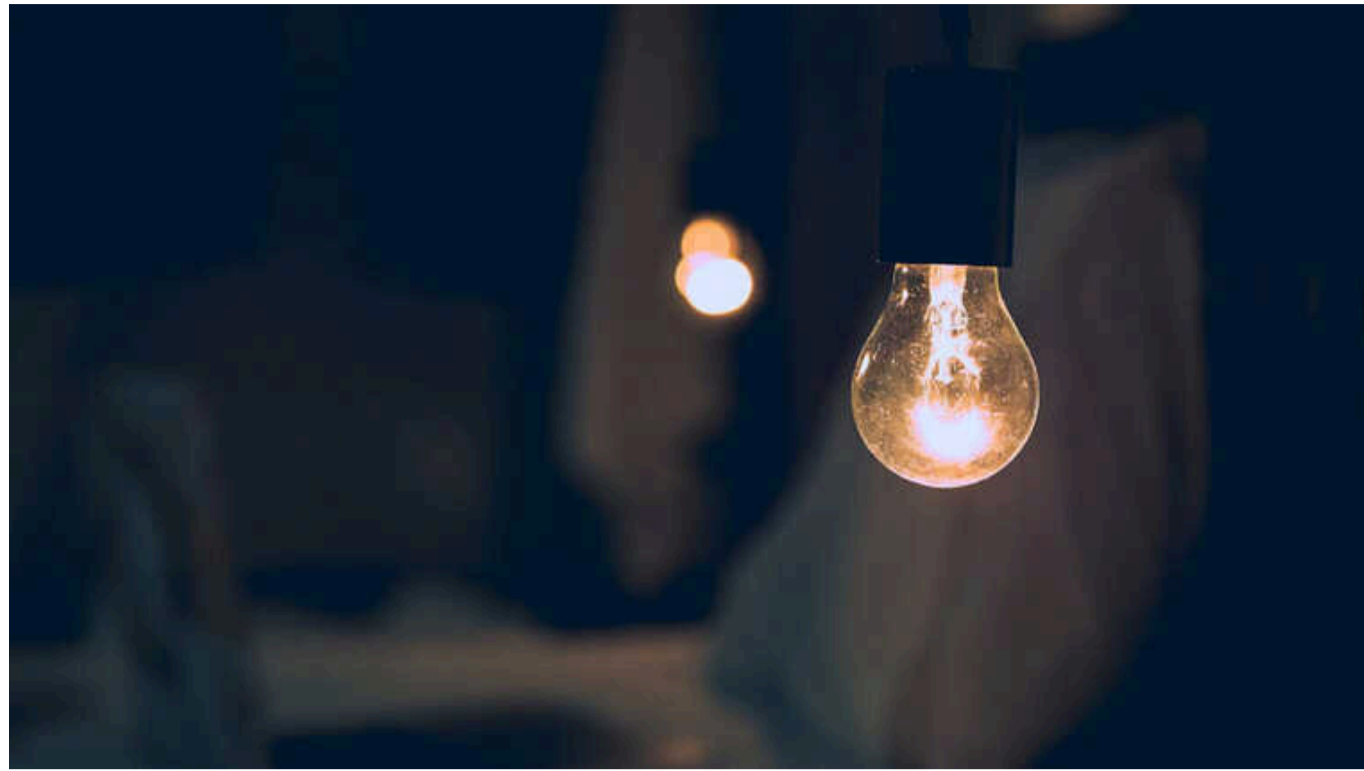
Відключення світла можуть тривати від 4 до 12 годин на добу, - "Укренерго"

Відключення світла можуть тривати від 4 до понад 12 годин на добу залежно від кількості черг, визначених "Укренерго". Тривалість і розподіл відключень визначаються обленерго в кожному регіоні, і залежать від дефіциту в енергосистемі.