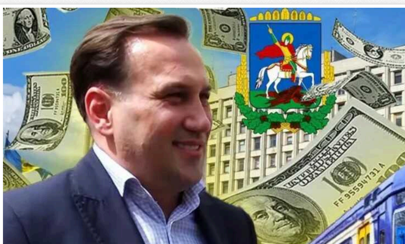
Як фігурант корупційних справ Гаєвий збагачується на суборенді держмайна?

Елітна нерухомість, дорогі автівки й відпочинок за кордоном: як виявляється, працюючи в комунальному підприємстві навіть під час війни, можна заробляти непогані статки. І сумнівна репутація тут – не завада.