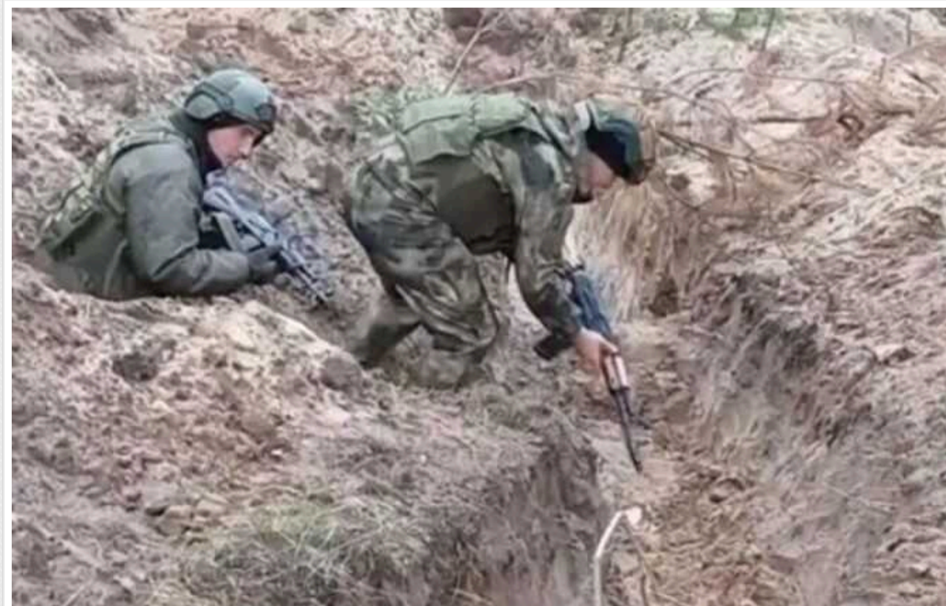
Партизан з "Атеш" розвідав базу росіян на Луганщині, де готують штурмовиків і снайперів

Агенти військового партизанського руху українців і кримських татар "Атеш" знайшли велику тренувальну базу ЗС РФ на тимчасово окупованій території Луганської області. Там ворог готує штурмовиків і снайперів для своїх воєнних операцій.