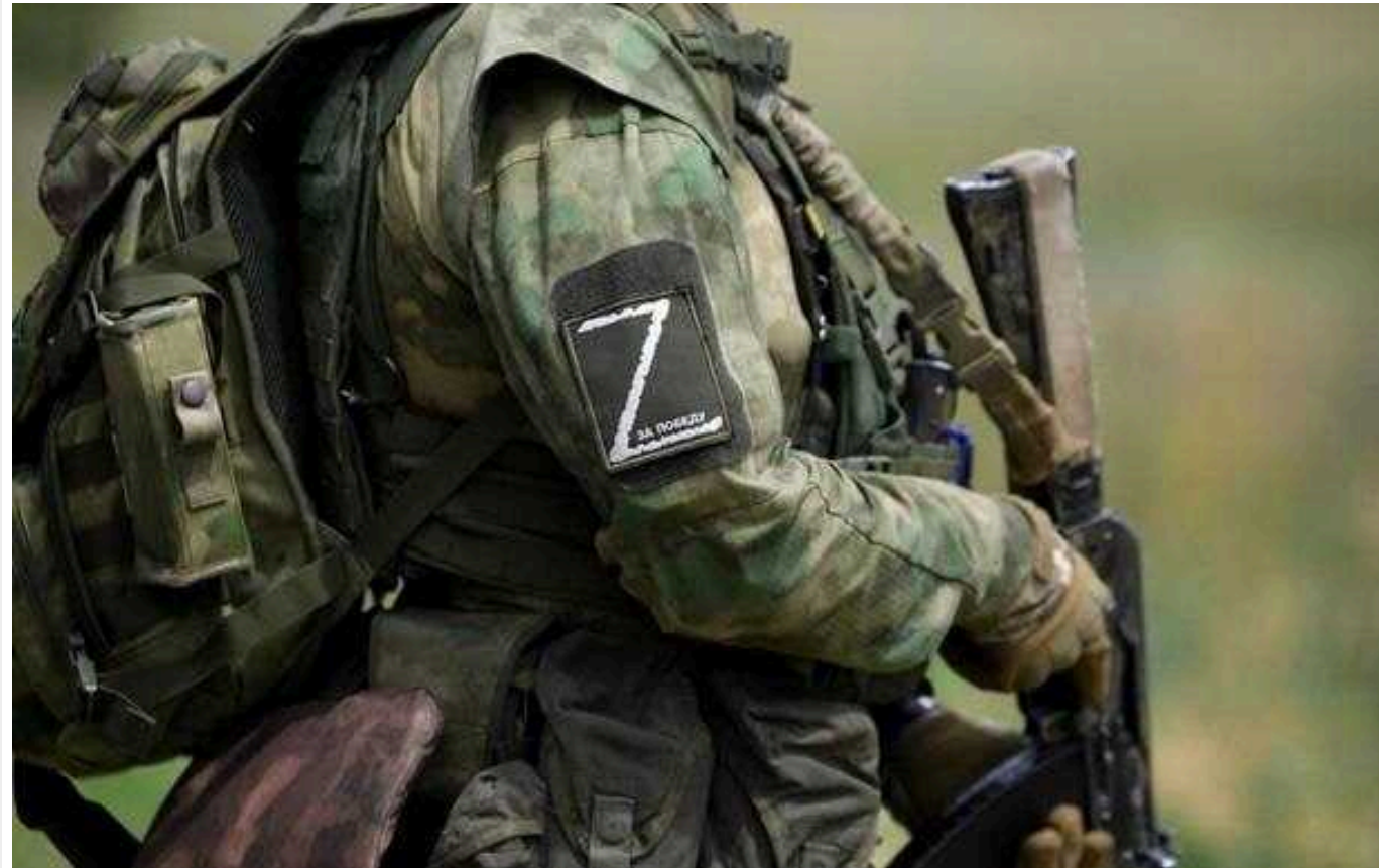
На Запорізькому напрямку окупанти розстріляли полонених українських воїнів

Окупанти розстріляли щонайменше двох українських полонених на Запорізькому напрямку.