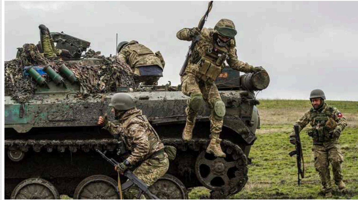
Військовий розповів, що відбувається на Торецькому напрямку: "Основний удар йде з боку Нью-Йорка і Шумів"

Росіяни просуваються під Торецьком завдяки значній кількості живої сили, яку кидають у бій, пояснив командир взводу 95 ОДШБр. Також він розповів, чи дійсно ворог робив підкопи, щоб підібратись до українських позицій.