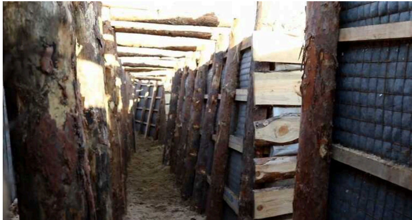
На сході України на закупівлях деревини для Сил оборони вкрали 140 мільйонів гривень

На закупівлі деревини для Сил оборони на сході України, а саме у Донецькій та Луганській областях, представники Міноборони вкрали 140 млн гривень.