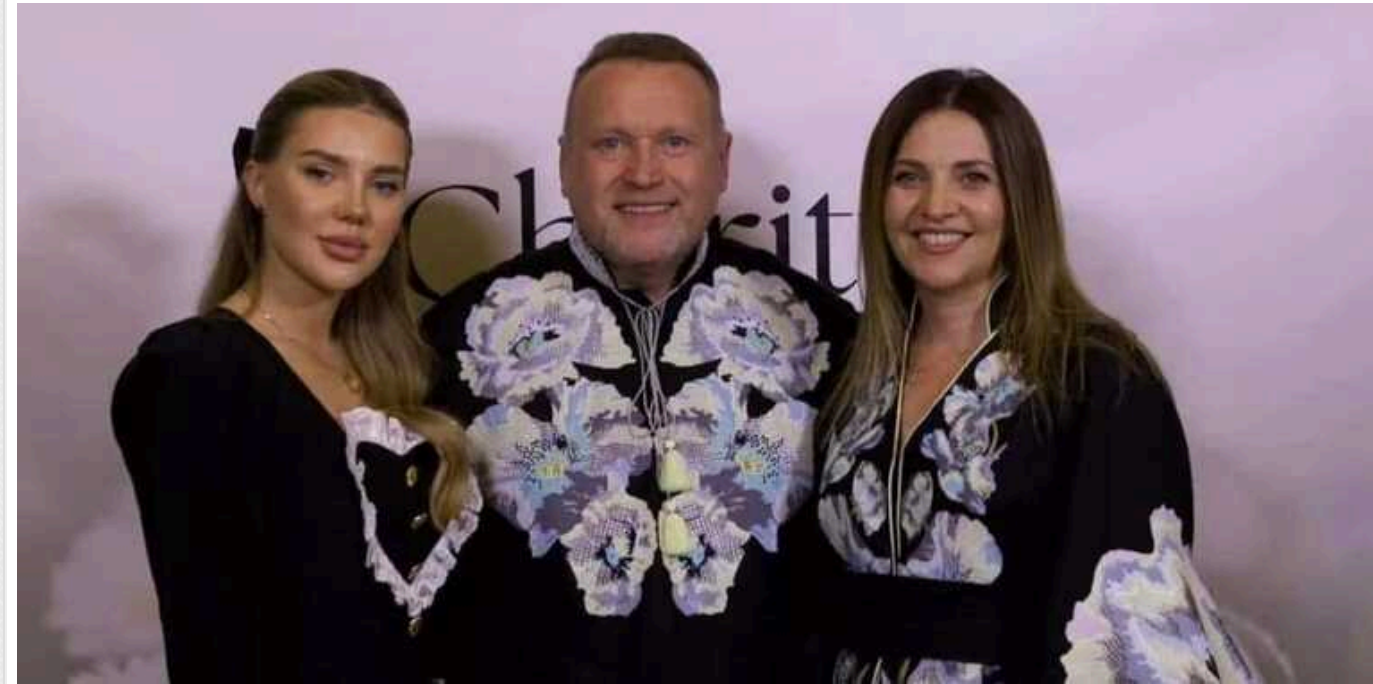
Справа скандального постачальника Міноборони Гринкевича пішла до суду

За пропозицію хабаря у $500 тис. Ігорю Гринкевичу загрожує до 8 років в'язниці.