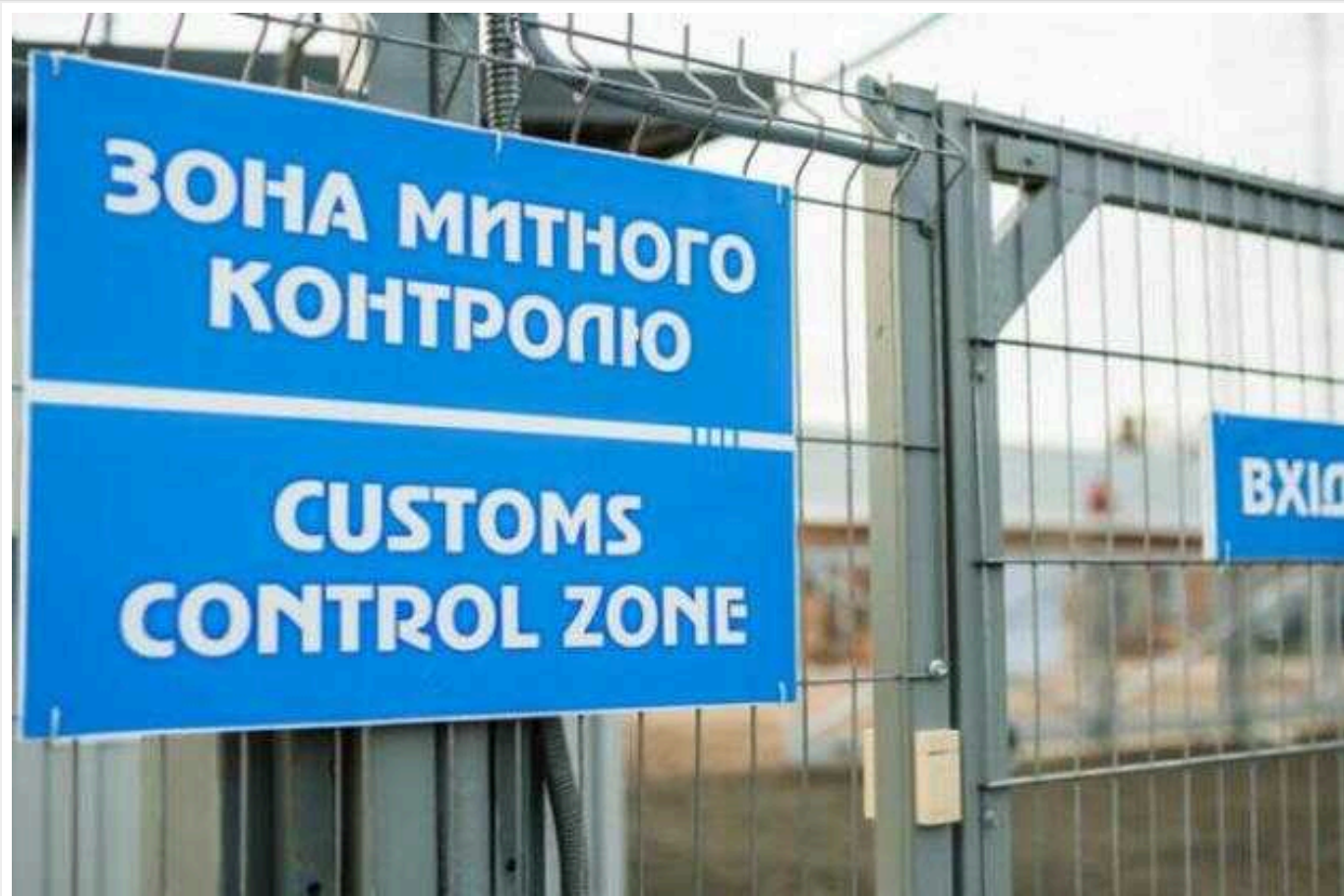
Чому шлях до прозорих призначень на митниці блокується Мінфіном?

Продовжуючи тему продажу посад на митниці, та ролі в цьому Мінфіну, прошу звернути увагу на законопроект 6490-д, який вже 15 місяців висить між першим та другим читанням, та який ніяк не хочуть вносити в зал для голосування.