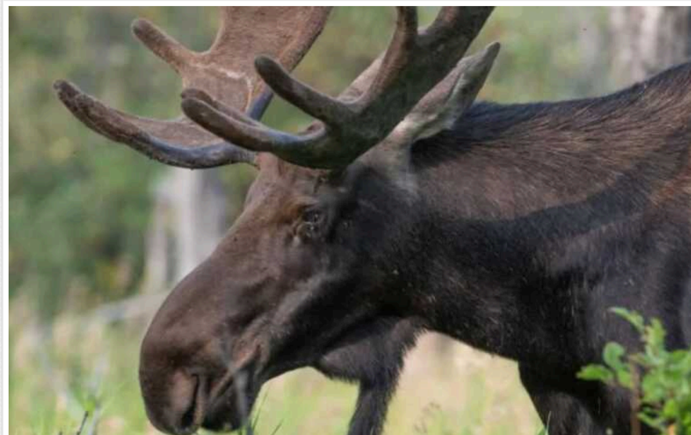
Внаслідок ракетного удару РФ по Києву 8 липня загинув врятований волонтерами лось

Тварина налякалася вибухів і з усієї сили вдарилася об стіну вольєру. Лось не вижив.