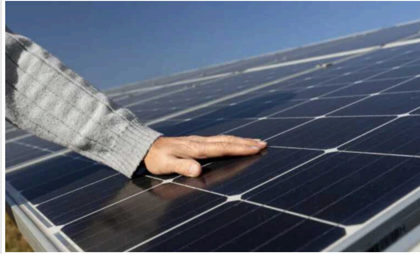
«У багатоповерхівках сидітимуть без світла»: сонячні батареї не врятують від відключень

Взимку найбільші проблеми зі світлом будуть від 7 до 11 ранку, та від 17 до 23 години. При чому у піковий час споживання електроенергії в зимові вечори немає сонця, а потрібно в цей час забезпечити себе електроенергією.