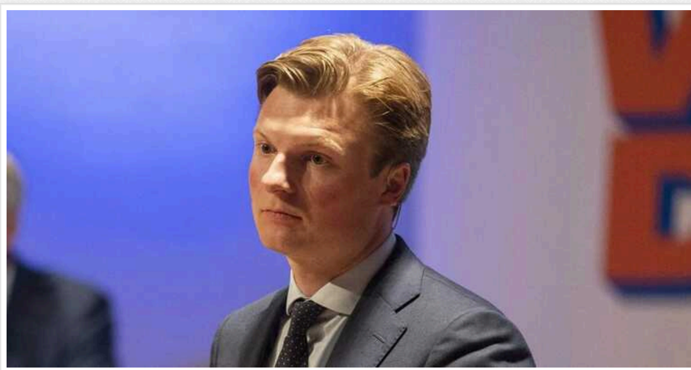
Міністр оборони Нідерландів Рубен Брекельманс відвідав підприємство з виробництва дронів в Україні

Під час першого робочого візиту в Україну новий міністр оборони Нідерландів Рубен Брекельманс разом із делегацією відвідав підприємство, яке виробляє дрони. Іноземні політики також провели переговори з представниками Міністерства оборони нашої країни.