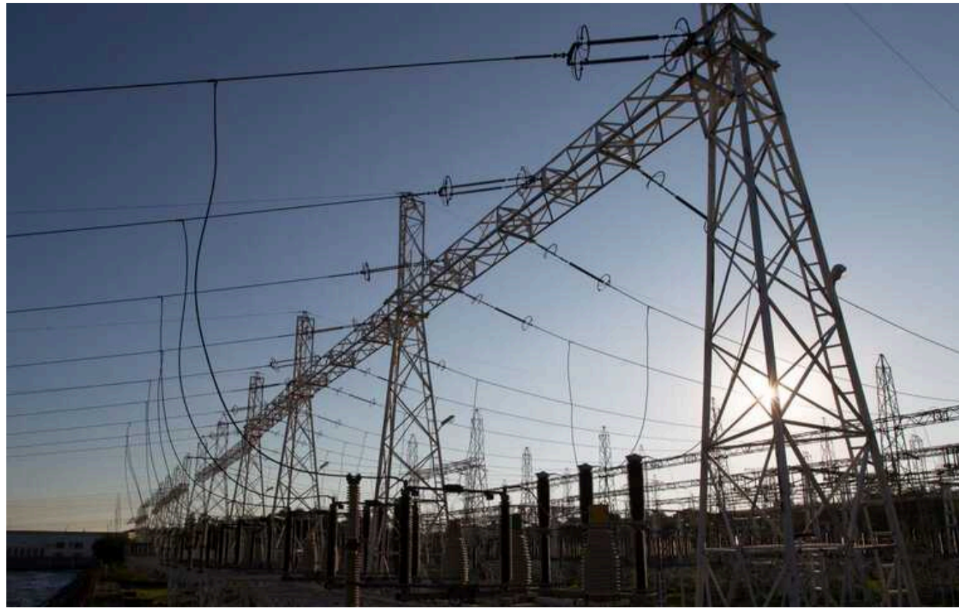
Шмигаль представив рішення Кабміну для стимулювання розвитку розподіленої генерації

Про це повідомляє нардеп Данило Гетманцев.