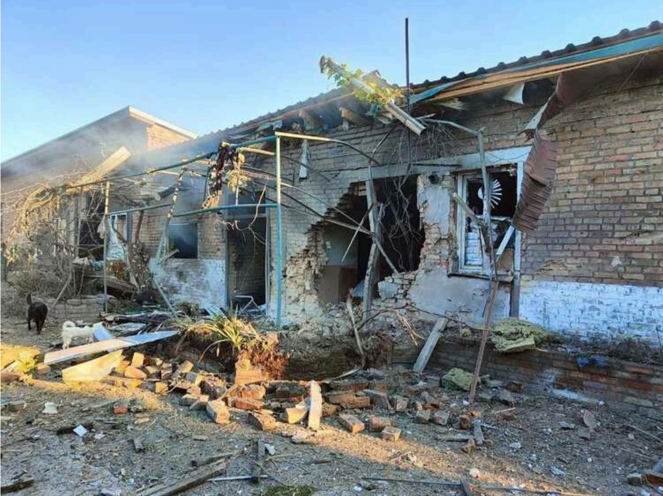
Загарбники вдарили по Павлограду на Дніпропетровщині: пошкоджено приватні будинки

У ніч проти 7 липня російська окупаційна армія завдала ракетних ударів по Дніпропетровській області. Під атакою ворога опинилося місто Павлоград.