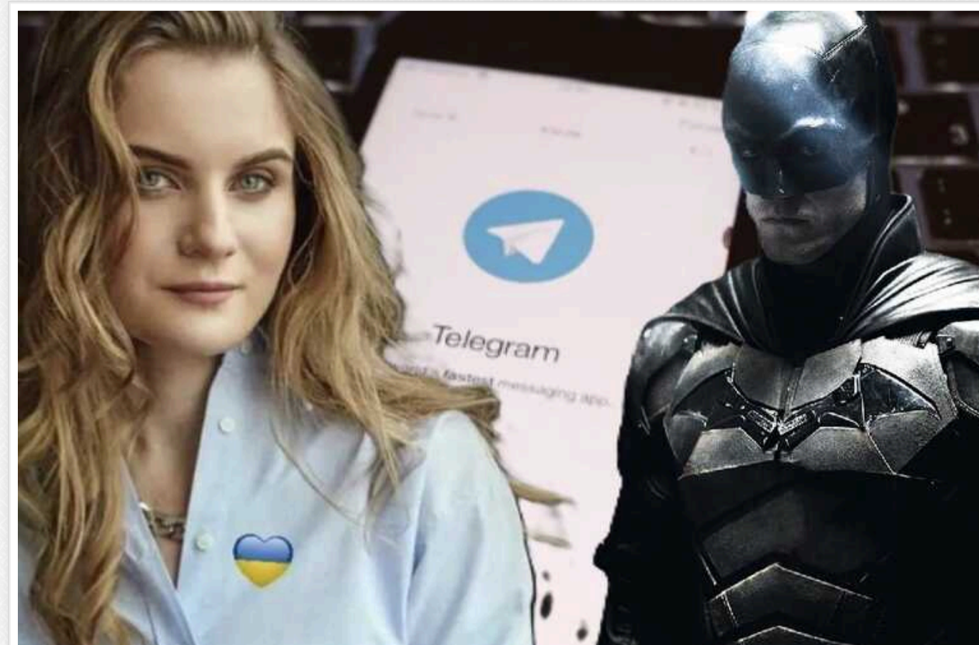
Хто стоїть за «Темным рыцарем»? ЗМІ назвали причетних