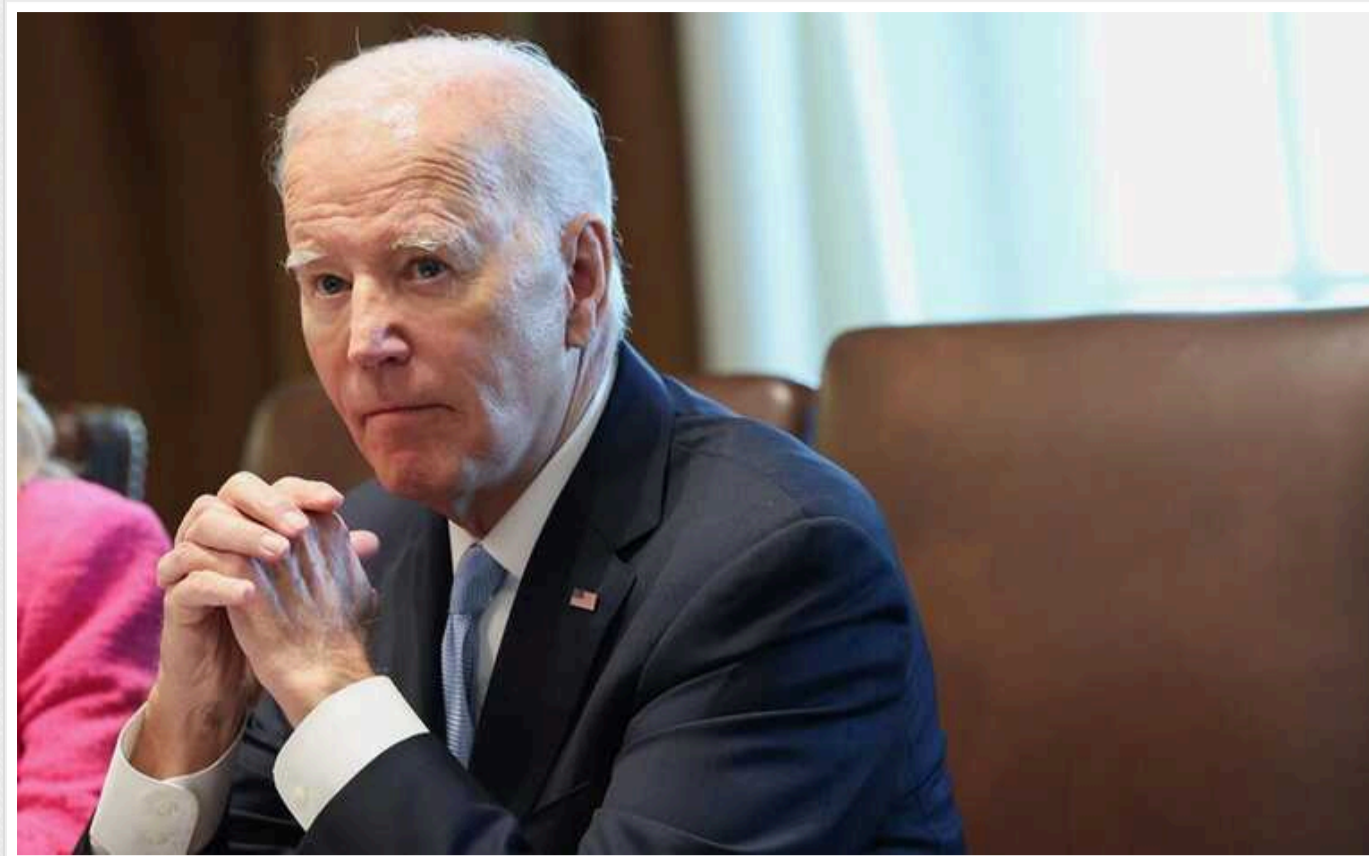
Bloomberg: в ЄС чиновники хочуть, щоб Байден знявся з виборів

Bloomberg пише, що європейські чиновники хочуть, щоб Байден знявся із виборів.