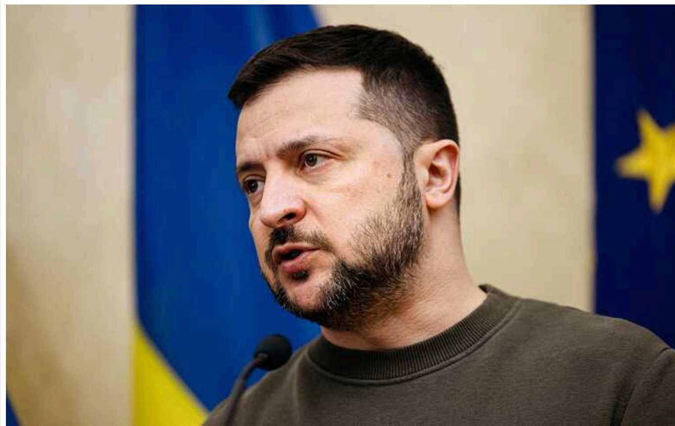
Президент анонсував безпекову угоду на саміті НАТО

Україна підпише ще одну безпекову угоду під час саміту НАТО 9-11 липня. Вона вже підготовлена.