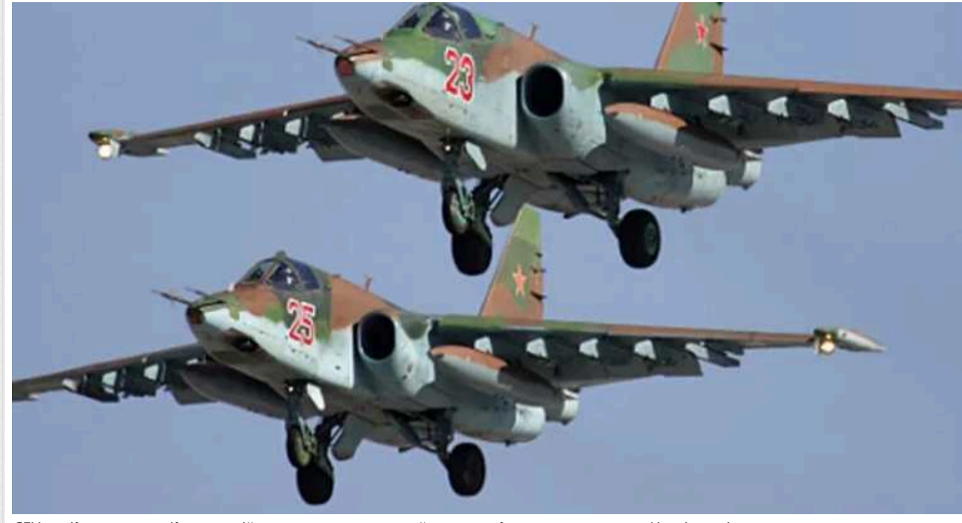
СБУ повідомила про підозру російському полковнику, який наказав ударити по музею на Харківщині

Служба безпеки повідомила про підозру російському полковнику Івану Панченку, який наказав завдати ракетного удару по Національному музею Григорія Сковороди у Харківській області. Окупант віддав злочинний наказ на початку травня 2022 року.