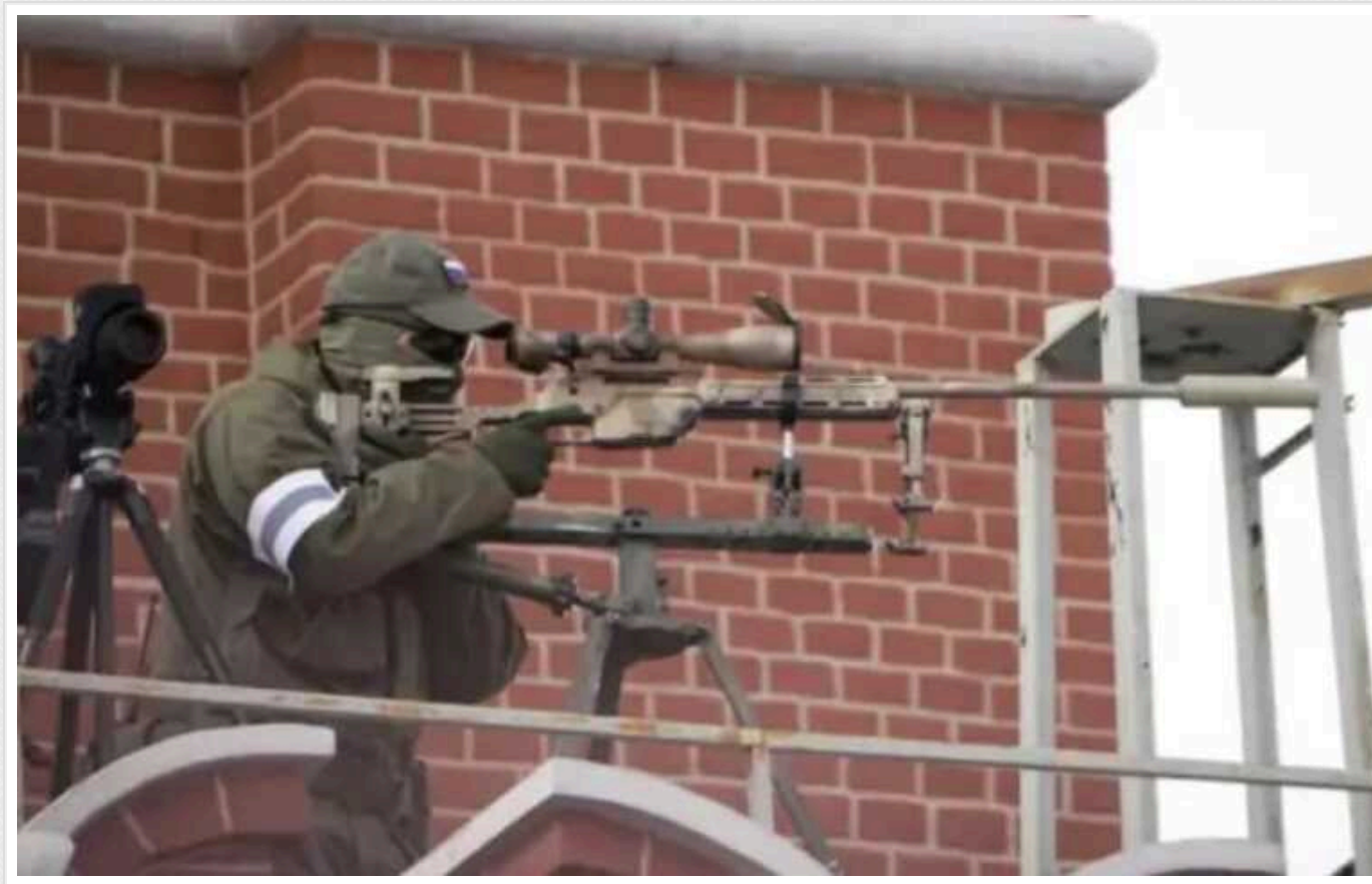
У російських снайперів помітили австрійські гвинтівки SSG 08

Як з'ясувалося, австрійські гвинтівки закуповувалися Росією до та після подій 2014 року. Причому західні видання ремствували, що санкційні обмеження не завадили армії РФ купувати гвинтівки SSG.