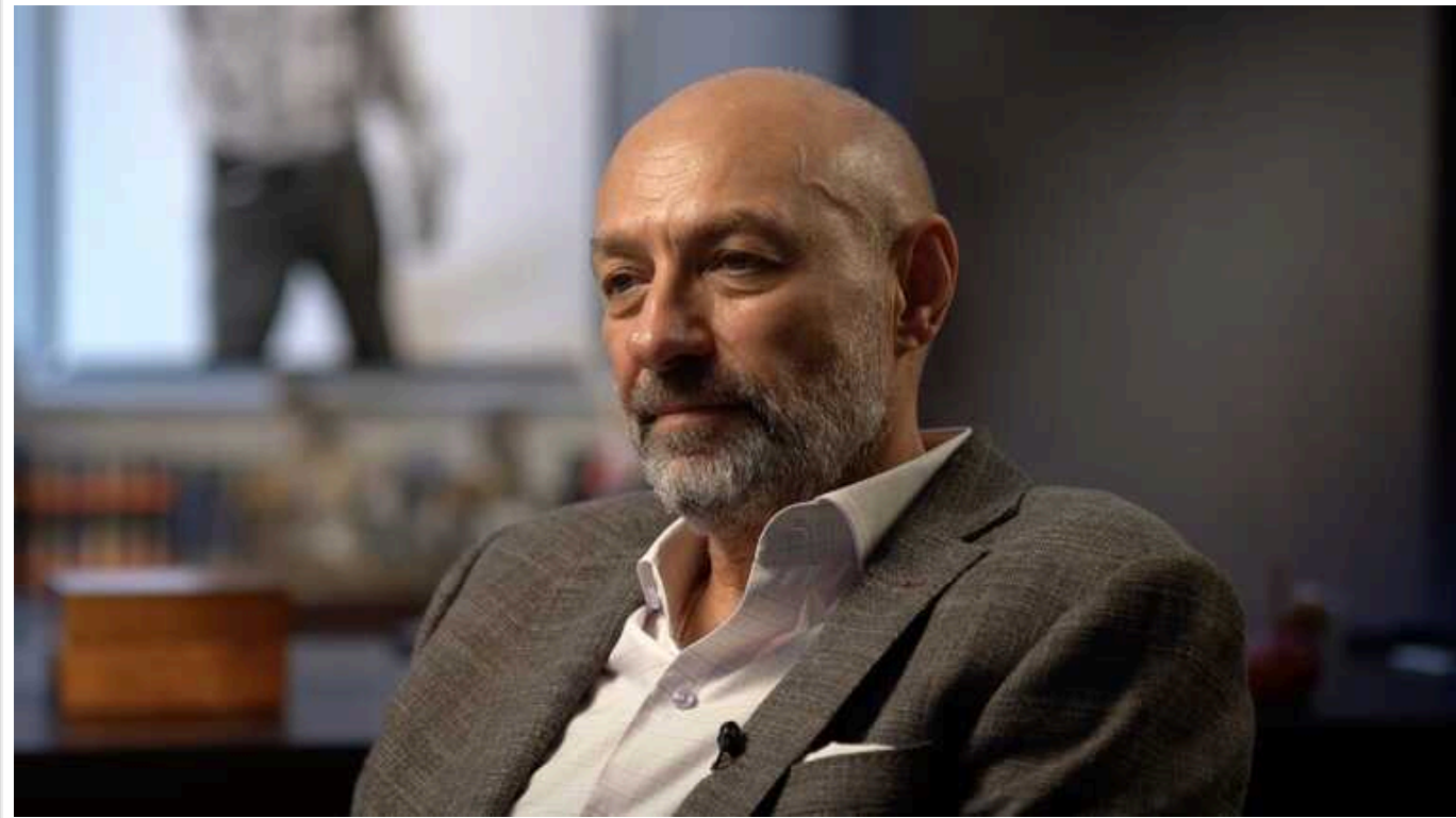
Соратник Коломойського олігарх Боголюбов втік із України

Співласник групи «Приват» залишив Україну: є підозри щодо нелегального перетину кордону.