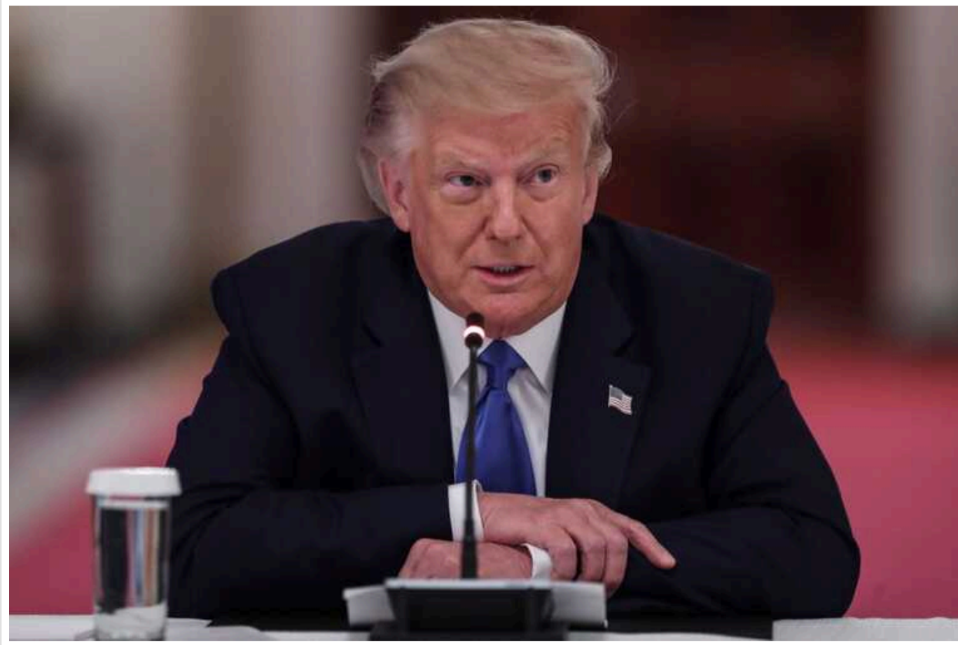
Трамп сподівається, що Байден не відмовиться від участі у виборах, - The Washington Post

Експрезидент та його команда розраховують на перемогу навіть з урахуванням звинувачень проти нього.