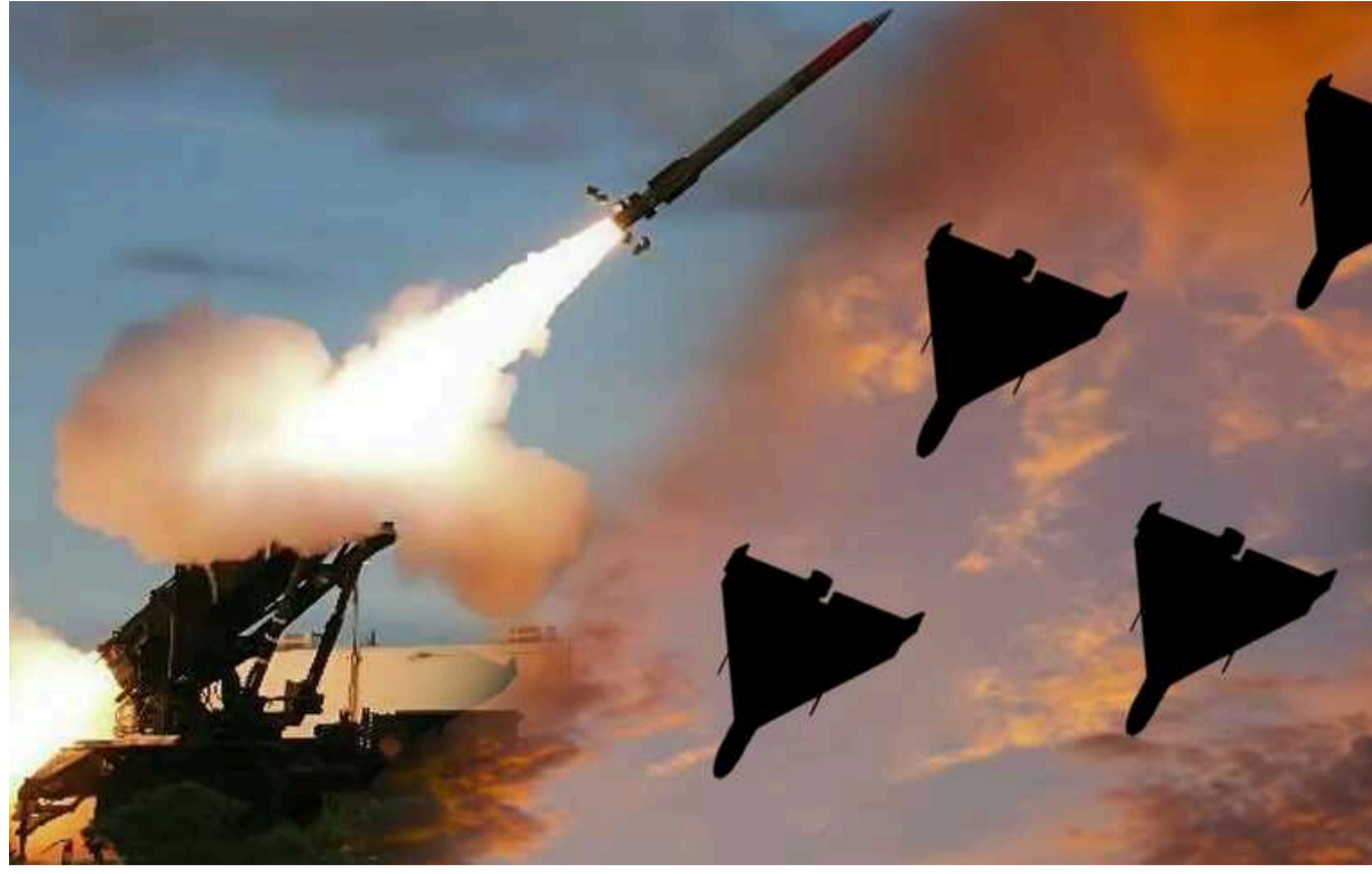
У деяких областях України оголосили повітряну тривогу: є загроза "Шахедів"

В кількох областях України оголосили повітряну тривогу пізно ввечері, 3 червня. Причиною є чергова атака російських загарбників із застосуванням ударних безпілотників.