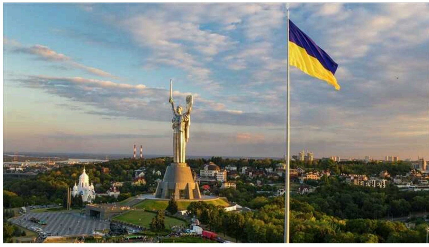
Київ є лідером за кількістю заяв про порушення мовного законодавства, - офіс мовного обмудсмена

Повідомляється, що кияни написали 34% усіх заяв, мешканці Одеської області – 19%, Харківської – 9%, Дніпропетровської – 9%, Київської – 4%, Запорізької – 2%, решта дала менше 2% «заяв» кожна.