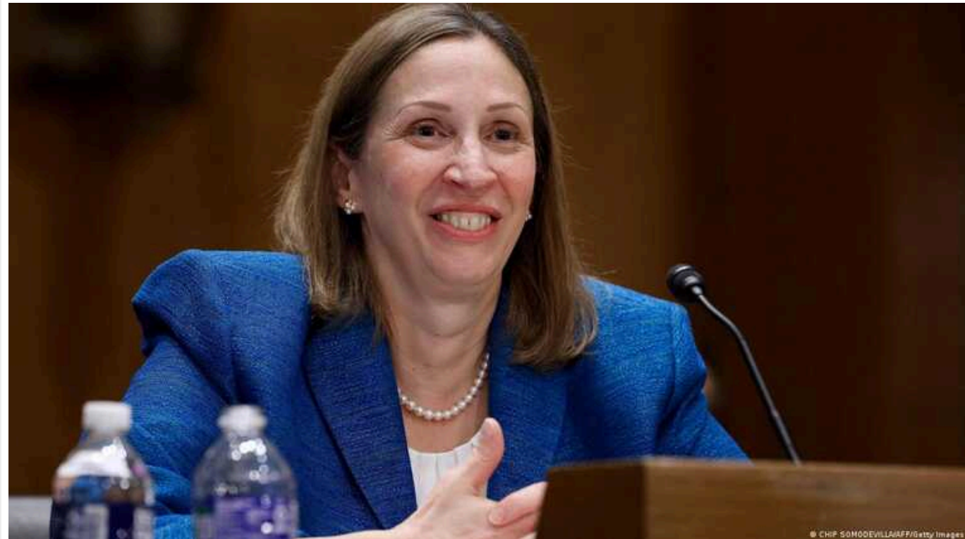
Посол США в РФ Лінн Трейсі заявила, що Україна та Росія втратили сукупно "понад 100 тисяч убитих", включно з військовими та цивільними

Вона каже, що "величезна кількість людей гине з обох боків. Це цивільні особи та молоді солдати, які гинуть або зазнають страшних поранень".