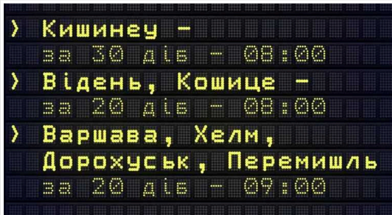
"Укрзалізниця" внесла зміни на популярні рейси до Польщі

"Укрзалізниця" з 4 липня змінює час старту продажу квитків на низку популярних міжнародних рейсів. Зокрема, у Польщу (Перемишль, Дорохуськ, Хелм, Варшава) реалізація починатиметься о 9:00. Глибина – 20 днів до дати відправлення.