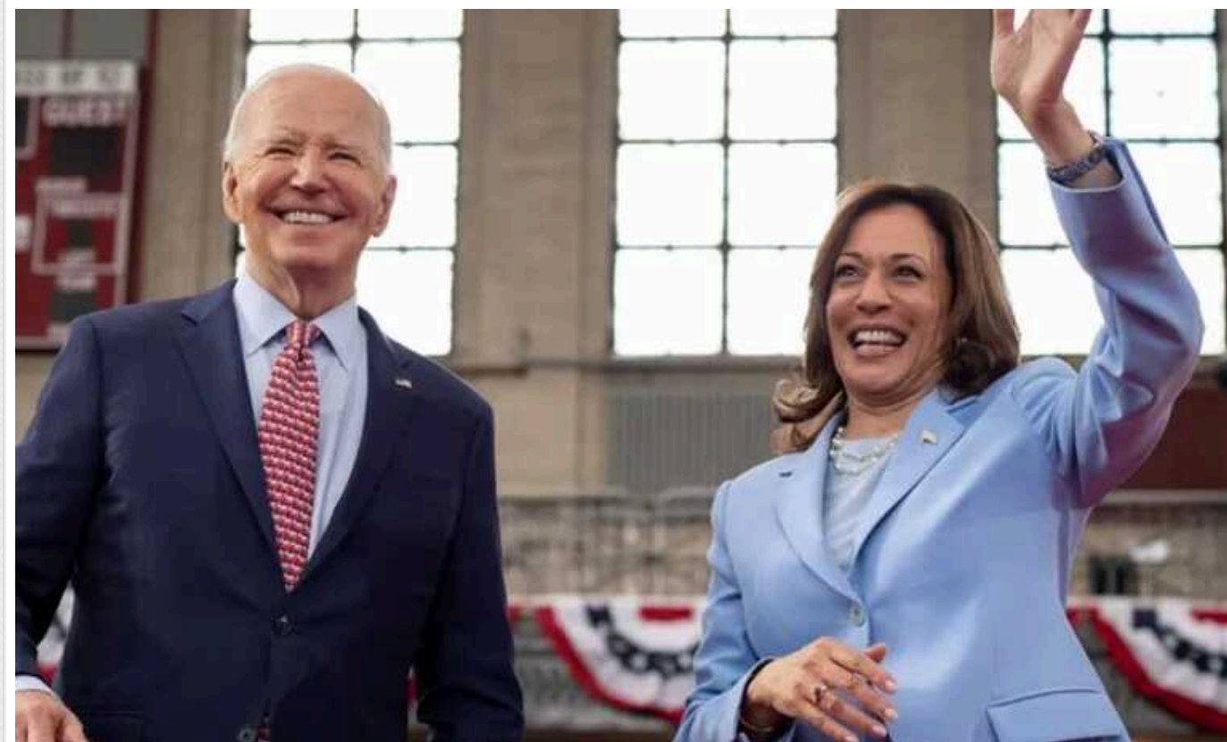
ЗМІ дізналися, кого у Білому домі вважають найкращим кандидатом на заміну Байдену, якщо той відмовиться від виборів

У Білому домі, а також у Демократичній партії США вважають, що віцепрезидентка Камала Гарріс є найкращою альтернативою для заміни Джо Байдена, якщо він вирішить не брати участь у президентських виборах. У Штатах ще ніколи не обирали жінку президентом.