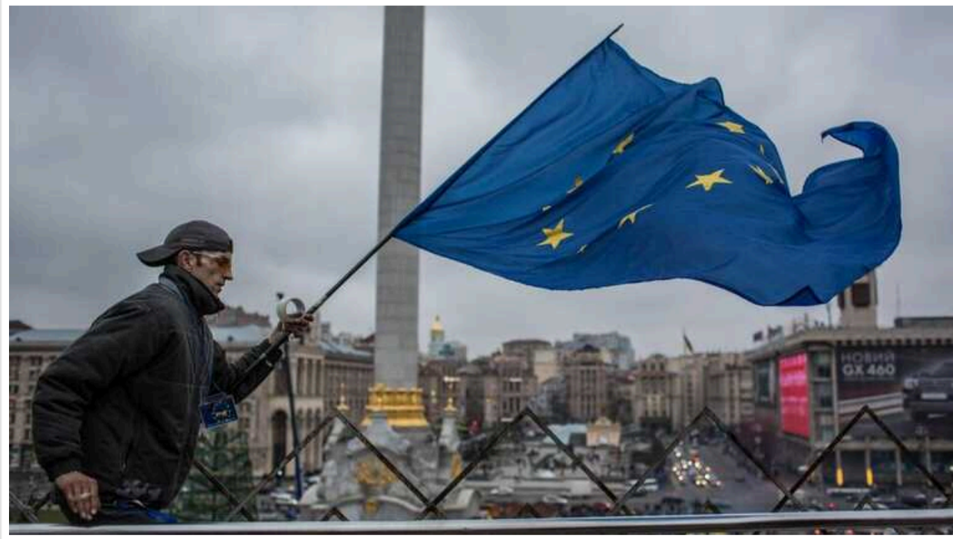
Європейці не вірять у перемогу України, але готові продовжувати постачати їй зброю, — опитування

Дослідження Євроради з міжнародних відносин свідчить, що лише в Естонії відносна більшість вірить, що Україна переможе у війні з Росією — 38%.