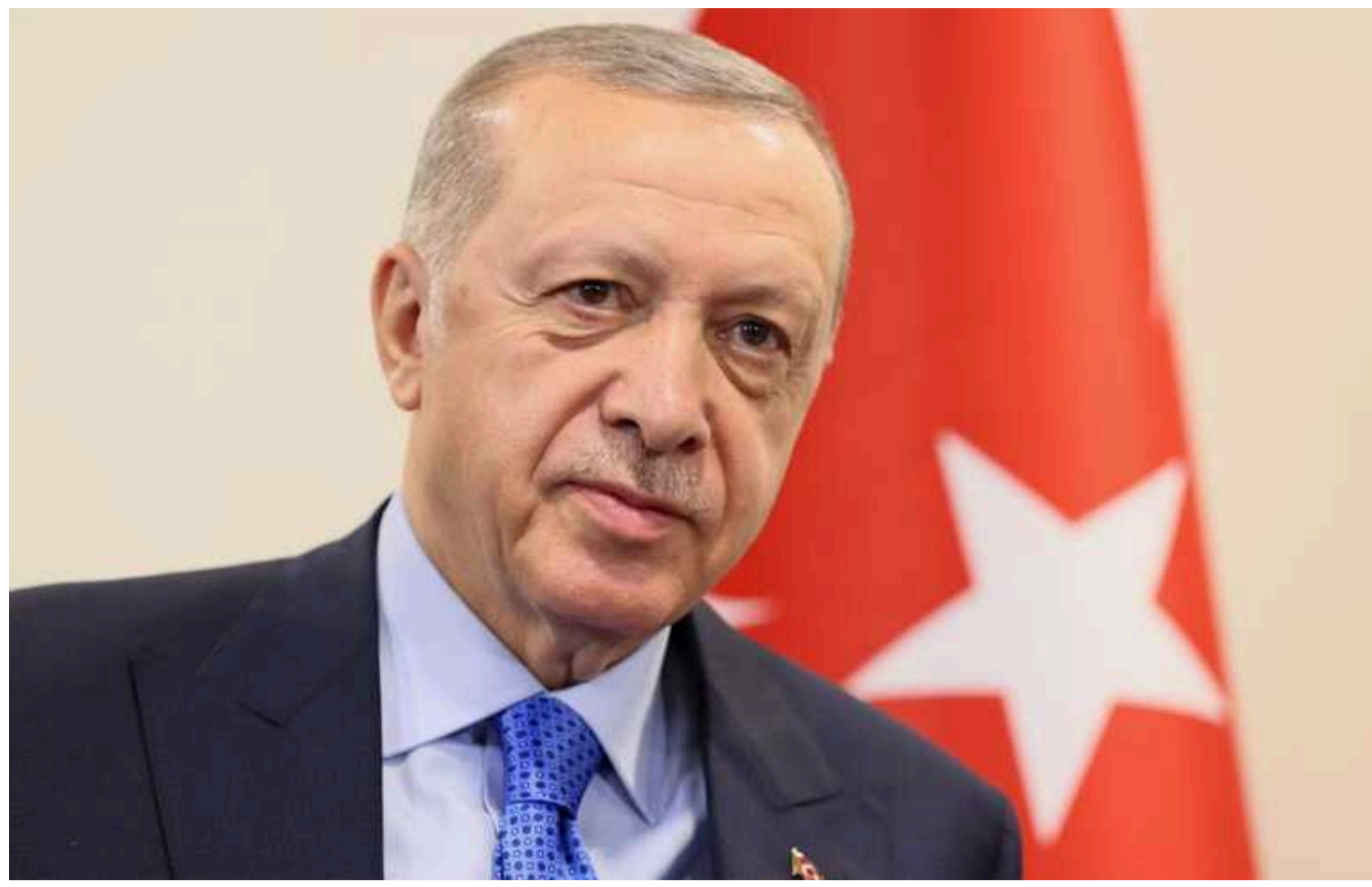
Ердоган: Туреччина хоче стати посередником для "справедливого миру" між Україною та Росією

Президент Туреччини Реджеп Тайїп Ердоган заявив, що його країна хоче стати посередником для "справедливого миру" між Україною та Російською Федерацією.