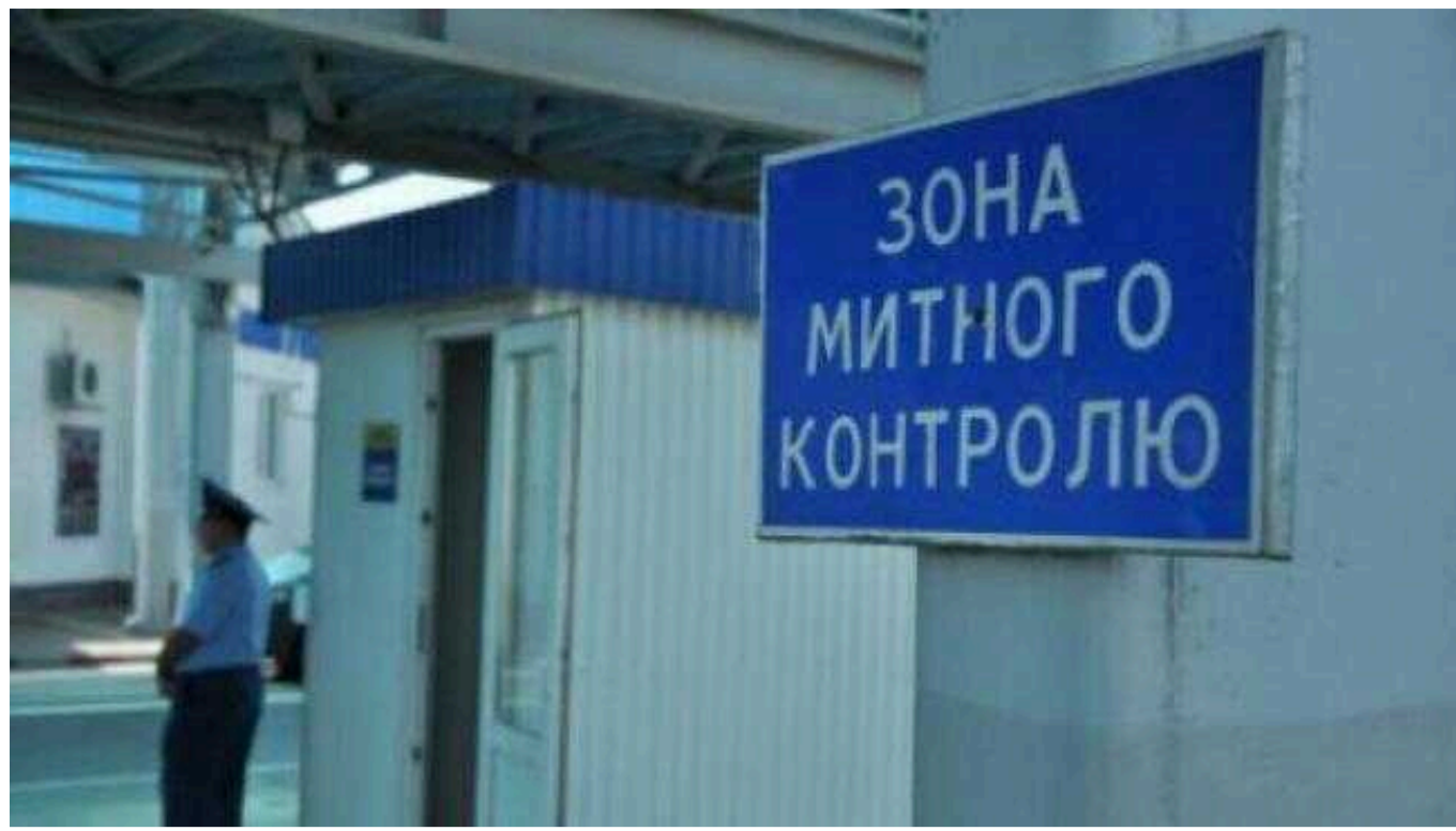
НАБУ та САП викрили на Рівненській митниці схему поборів при ввезенні імпортованих товарів

Національне антикорупційне бюро України та Спеціалізована антикорупційна прокуратура викрили схему поборів при ввезенні імпортованих товарів на Рівненській митниці.