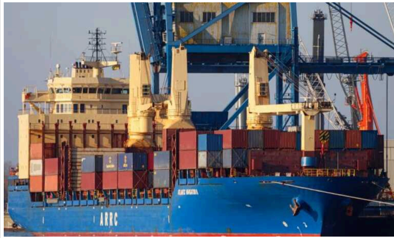
У Німеччині за порушення санкцій ЄС на 8 тисяч євро оштрафували капітана російського судна

Капітан російського вантажного судна Atlantic Navigator II, яке кілька тижнів утримувалося в порту німецького Ростока, змушений був заплатити штраф у розмірі 8 000 євро за порушення санкцій ЄС.