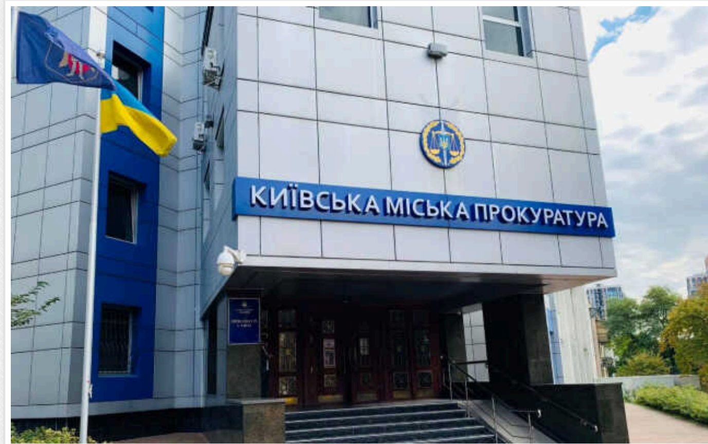
У Київській і Житомирській областях на ремонті доріг вкрали понад 121 мільйона гривень, – Київська міська прокуратура

За процесуального керівництва Київської міської прокуратури скеровано до суду обвинувальні акти щодо службових осіб підприємства-підрядника та працівників Служб автомобільних доріг у Київській та Житомирській областях, які під час ремонту доріг заволоділи бюджетними коштами на загальну суму понад 121 млн гривень.